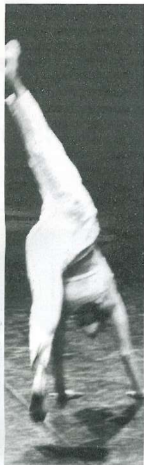
Guicciardini per il Gruppo

Giardino Chiuso (giovedì 24, ore 21 e venerdì 25 ore 22).